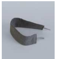
一般的なタッセル