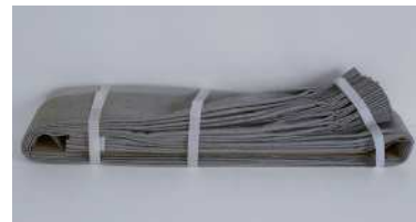
ヒダたたみ・専用台紙