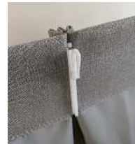
サンゲツのフック