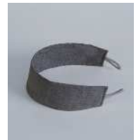
サンゲツのタッセル