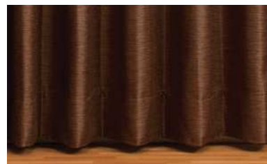
LP仕様 (形態安定加工・約1.5倍ヒダ) の仕上りイメージ

アイロンがけはほとんど必要がありませんが、もしご使用の際はごく低温(110℃以下)にてかけ、一定箇所に長くかけないでください。またドラム式乾燥機の使用は、プリーツを消失させる恐れがありますのでお避けください。ライトプリーツ加工を施しますと見本帳表記の取扱表示の洗濯表示記号が右表のように変わり、適応する取扱表示が製品に添付されます。洗濯機、手洗い可・不可表示については変更ありません。